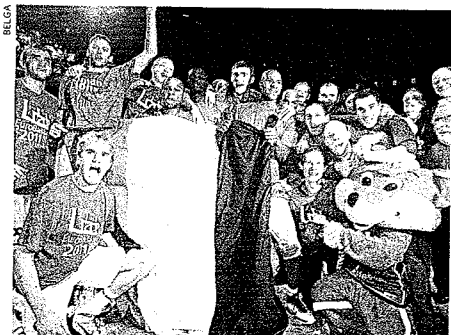
Les Lions ont joué avec leurs tripes hier soir à l'Arena à Anvers lors du match décisif pour la qualification de l'Euro 2011